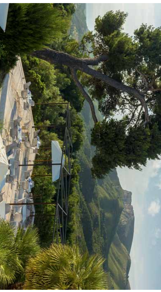
In frischen Blautönen präsentiert sich das gemütlich-gelegte Bistro „Bahia“ von dessen wunderschöner Terrasse aus man auf den Felsen Ferrata, die Bucht von Alcudia und das