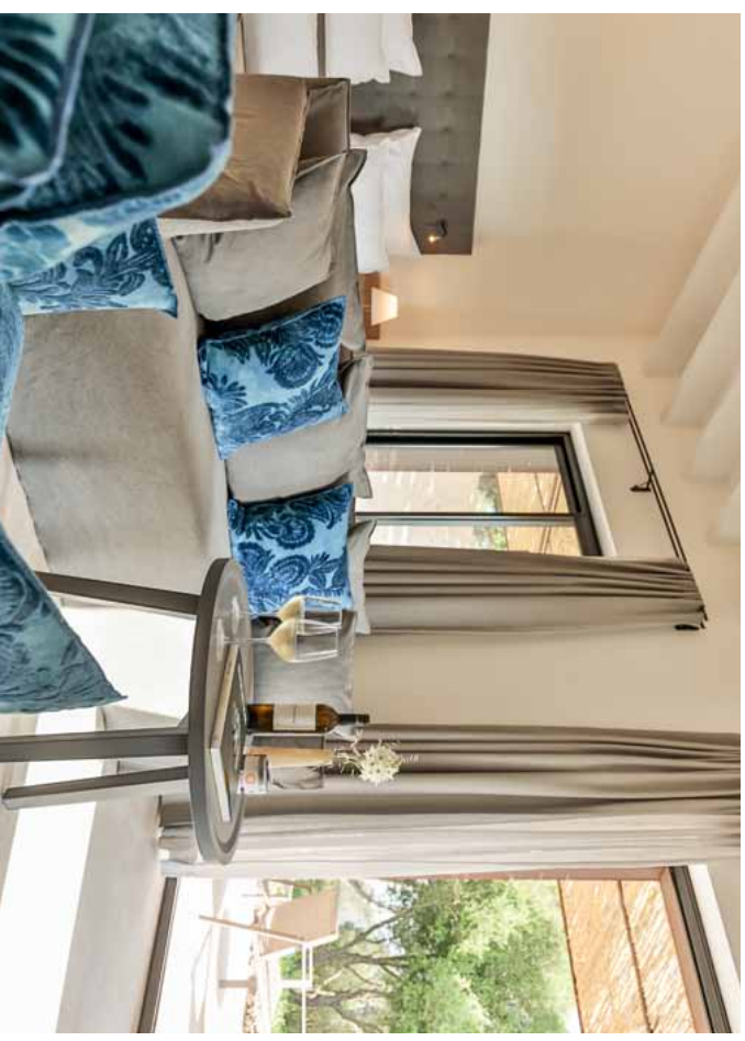
Jede Menge Komfort und Privatsphäre kennzeichnet die komfortablen Bay-View-Suiten, von deren Terrassen aus Gäste entspannt zur Bucht von Alcaldia hinüber blicken.

Was für ein Ausblick! Auf den Terrassen der Suiten kann man herrlich entspannen und dem mannigfachen Vogelgezwirnscher andächtig lauschen.