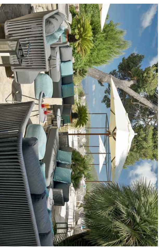
Die stylische Lounge an der „Bahia“-Terrasse lädt zum gemächlichen Beisammensein und angesagten Cocktail-Kreationen ein.